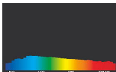
Lumière du jour (D 65)